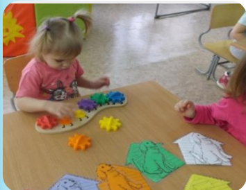
«Найди домик для собачки»