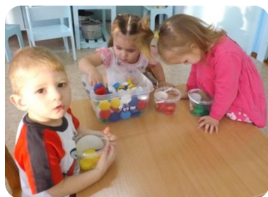
«Подбери по цвету крышки»