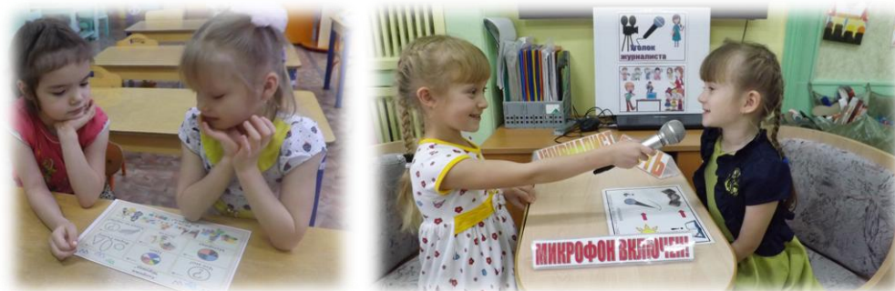
Схема-подсказка состоит из картинок-символов. По этим картинкам педагог совместно с ребятами подбирает возможные варианты вопросов, которые можно задать. Затем, уже в процессе самого интервью, ребенок-корреспондент выстраивает свой диалог, имея перед собой зрительную опору в виде картинок-символов.

Это позволяет детям учиться задавать вопросы и грамотно на них отвечать, соблюдать последовательность в передаче событий, устанавливать контакт с респондентом и вести диалог, выделять